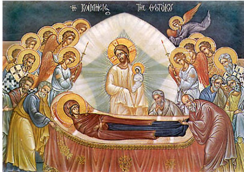
La Dormition de la Mère de Dieu

Chers frères et sœurs en Christ, chers amis et amies,